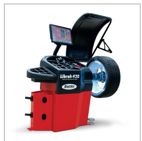
La nuova equilibratrice Butler Librak 430.3D TECH