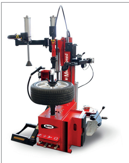
Memo è la combinazione tra lo smontagomme tradizionale e la tecnologia Butler leverless

nazione perfetta tra lo smontagomme tradizionale e la tecnologia Butler leverless già sperimentata da anni. Ciò consente di ottimizzare al massimo i tempi di lavoro, grazie all'utilizzo di un esclusivo sistema di memoria della posizione utensile sul bordo cerchio che lo rende particolarmente veloce ed efficace su tutti i tipi di ruote: soft,