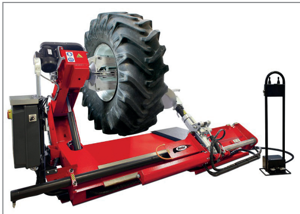
Il nuovo smontagomme per autocarro Navigator 51.15 EI

Butler è conosciuta in tutto il mondo per il suo unico sistema leverless che permette di lavorare vicino al bordo cerchio, evitando di creare stress sul tallone ( Zero Stress Effect System ) e, al contempo, di danneggiare il cerchio, in quanto utilizza una lega anti-graffio brevettata. A completamento della già ampia gamma di smontagomme di livello "top", quest'anno Butler presenta un nuovo modello, denominato Memo : una combi-